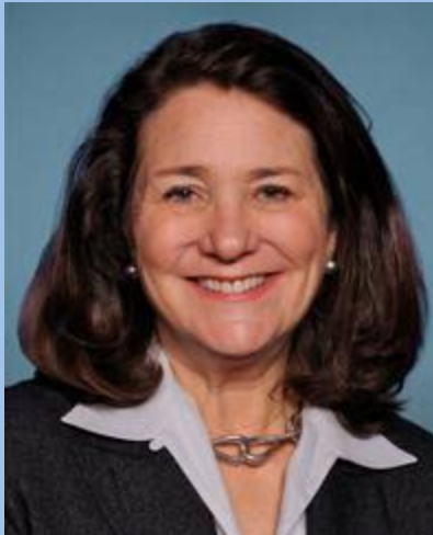
Greenlee Family Foundation