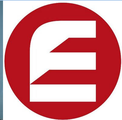
Ent Credit Union