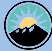
The Denver Foundation