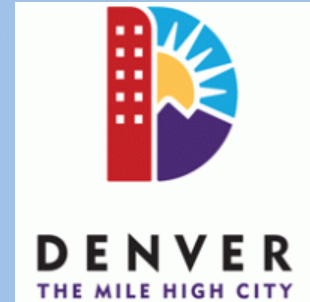
DIURA Immigrant Integration Sponsorship